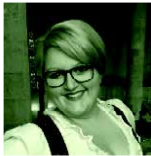
Julia Pichler / BI