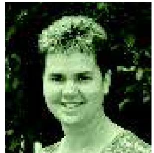
Beatrix Brandner / BI