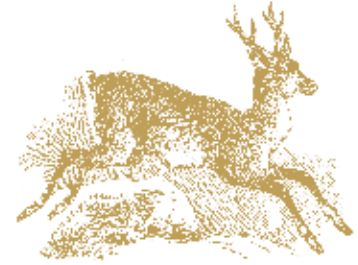
Anton Baumann Die Stanzer Lauflegende in Aktion