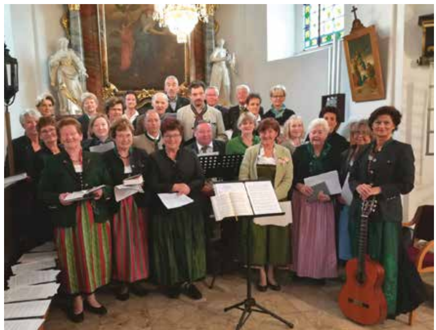
Gottesdienst in St. Kathrein am Hauenstein

Singen stärkt unsere Gemeinschaft in der Stanz