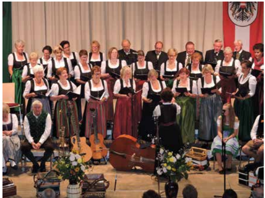
Konzert in Breitenau mit dem Stoanrieser Dreigesang